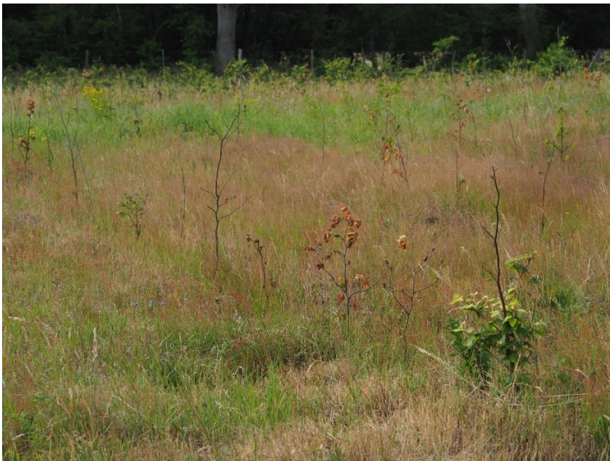
Foto: Mit Buchen und Douglasien neu aufgeforstete Fichten-Windwurflläche bei Hamburg, Zustand nach Dürresommer 2018

Nachdem auch das Frühjahr 2019 sehr trocken war, zeigt sich, dass auch die Laubbäume nicht ohne Schäden blieben. Kronenverlichtete Eichen und Buchen, Rotbuchen mit eingero-llten Blättern, Herbstfärbung oder gar gänzlich ohne sommerliches Laub zeigen deutlich, dass selbst alte Bäume mit tiefreichenden Wurzeln unter dem Wassermangel 2018/19 leiden.