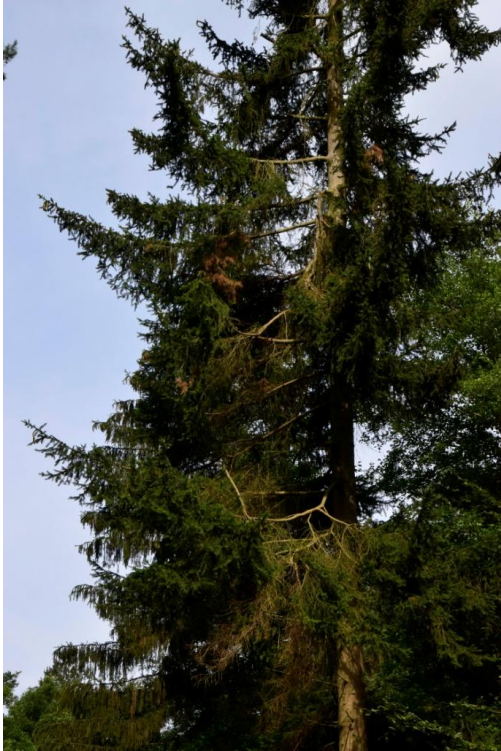
Durch Trockenheit und Borkenkäferbefall schon stark geschädigte Fichte

Der Ameisenbuntkäfer legt gerne seine Eier in feuchtem Totholz ab. Seine Brut ernährt sich bis zu ihrer Reife von Pilzen und anderen Insekten, wie beispielsweise der Splintholzkäferlarve.